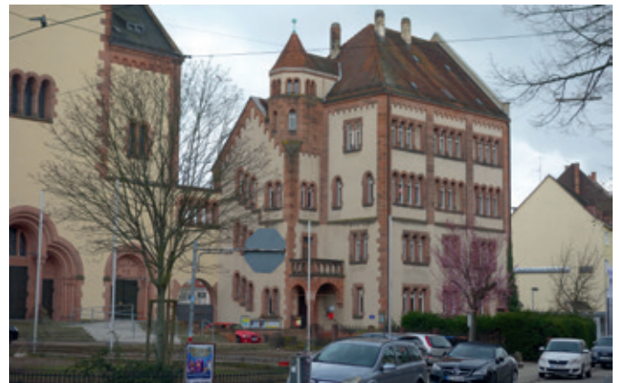
Das Pfarrhaus St. Bonifatius in der Sophienstr. 127, wird anfang nächsten Jahres generalsaniert.

Das Pfarrbüro St. Bonifatius ist am 28. August umgezogen. Alle Informationen, neue Adressen der pastoralen Mitarbeiter und die neuen Öffnungszeiten finden Sie hier und auf Seite 16.