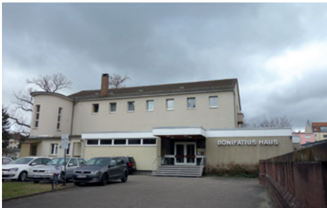
Altes Bonifatiushaus in der Schillerstr. 46. Bald wird hier neu gebaut.